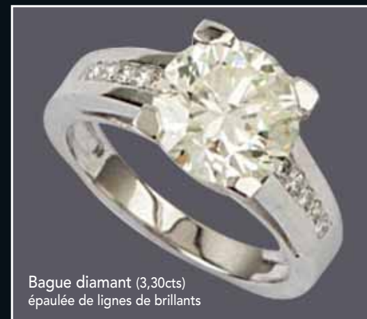
Bague diamant (3,30cts) épaulée de lignes de brillants