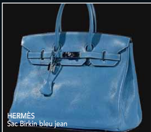
HERMÈS Sac Birkin bleu jean