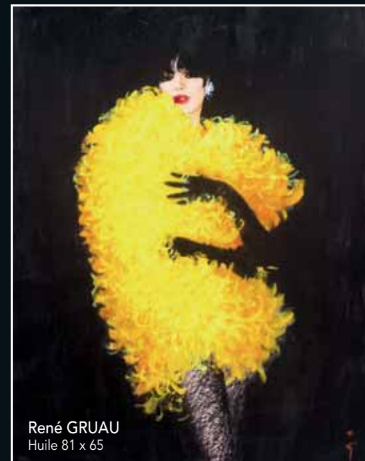
René GRUAU Huile 81 x 65