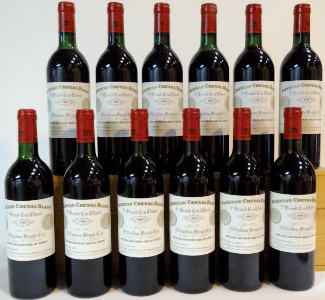
Lot 53 (12 BOUTEILLES CHÂTEAU CHEVAL BLANC 1985)