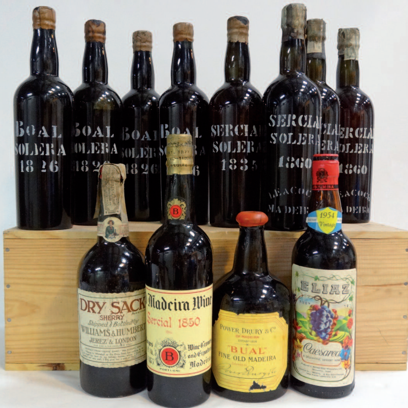
LOTS 414 À 417