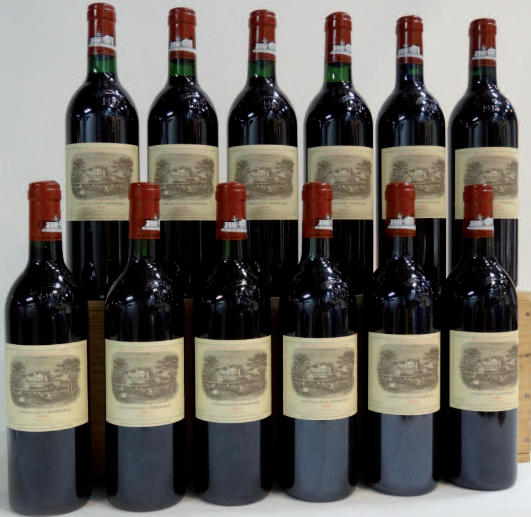
Lot 50 (12 BOUTEILLES CHÂTEAU LAFITE ROTHSCHILD 1985)