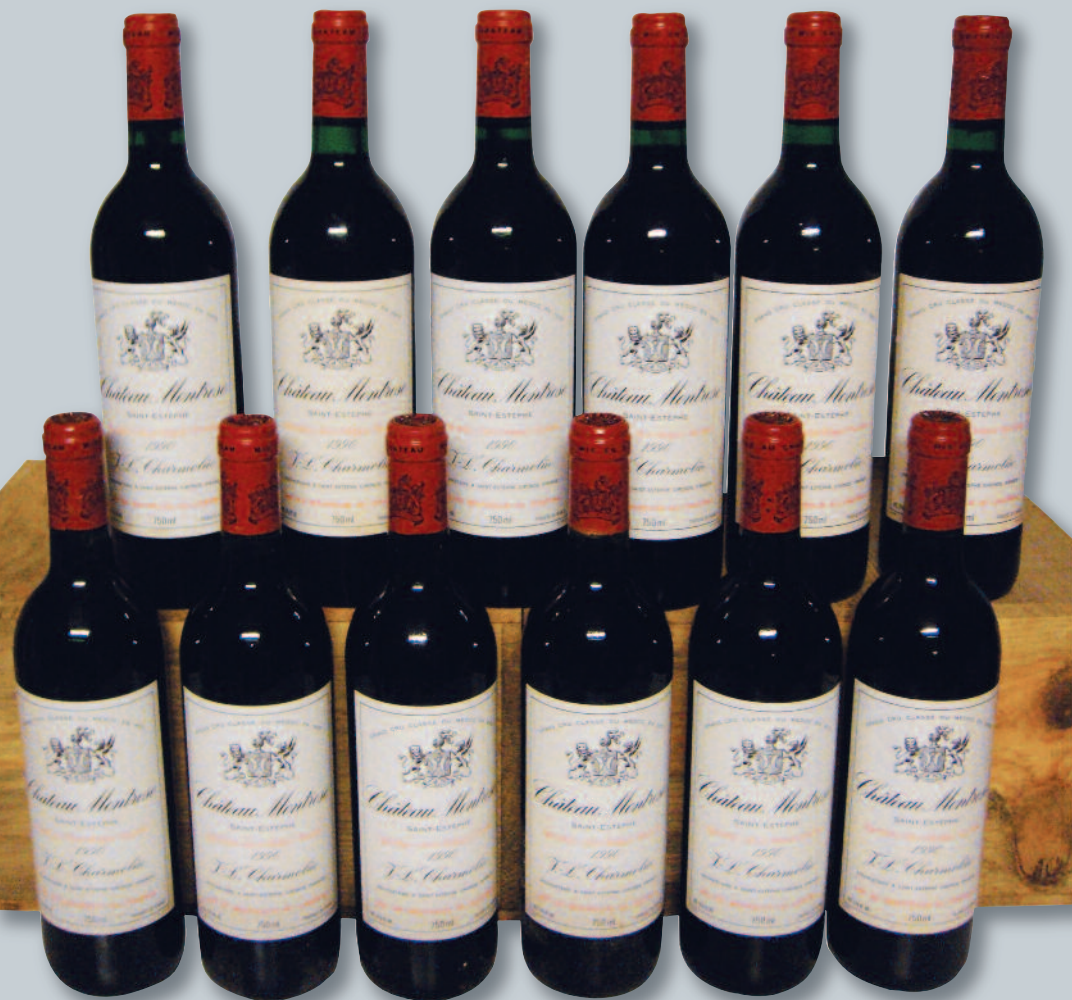
Lot 59 (12 CHÂTEAU MONTROSE 1990)