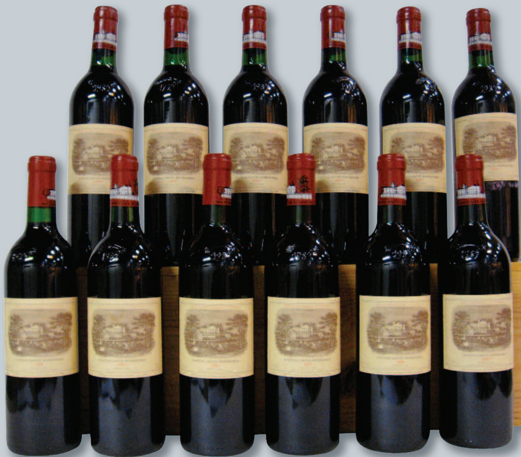
Lot 194 (12 CHATEAU LAFITE ROTHSCHILD 1985)