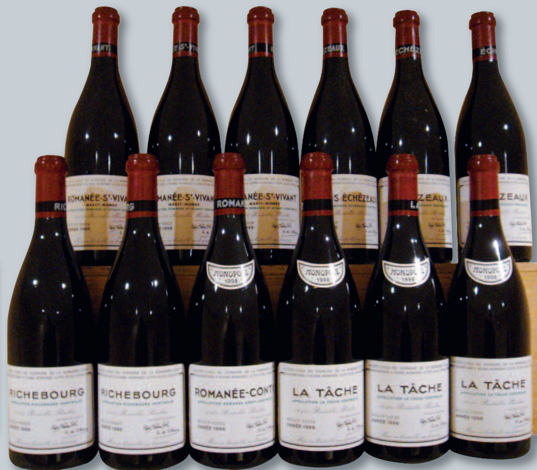
Lot 200 (ASSORTIMENT DU DOMAINE DE LA ROMANÉE CONTI 1998)