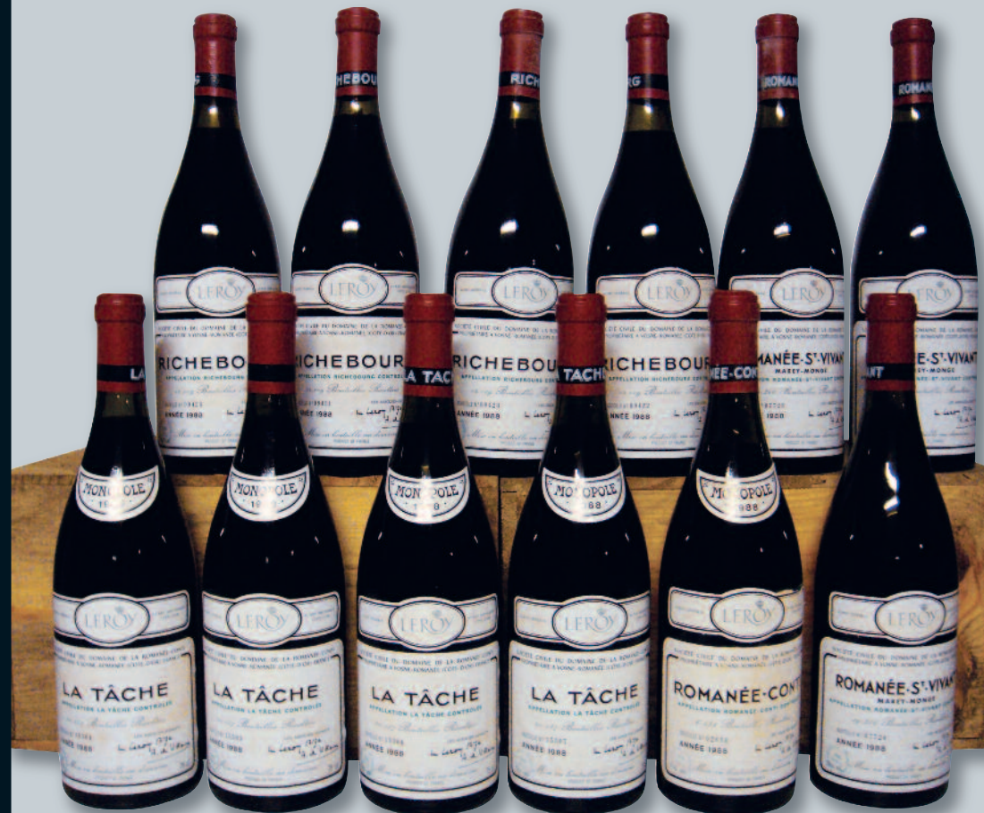
Lot 135 (ASSORTIMENT DU DOMAINE DE LA ROMANÉE CONTI 1988)