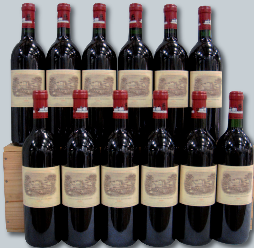
Lot 163 (12 CHÂTEAU LAFITE ROTHSCHILD 1990)