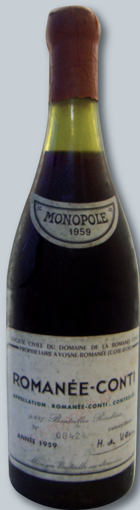
Lot 90 (ROMANÉE-CONTI 1959)