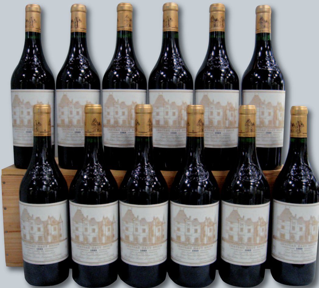
Lot 153 (12 CHÂTEAU HAUT-BRION 1989)