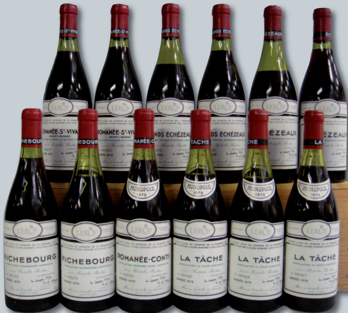
Lot 200 (ASSORTIMENT DOMAINE DE LA ROMANÉE-CONTI 1978)