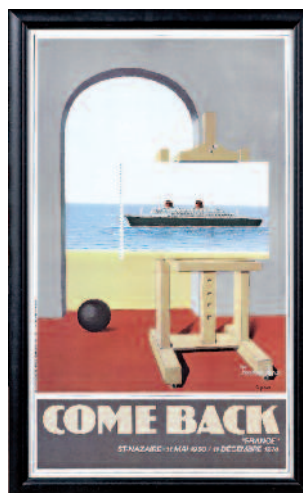
4 - Affiche encadrée de la FRENCH LINE par CIGANER avec inscription : "COME BACK ST- NAZAIRE - 11 MAI 1960 / 11 DECEMBRE 1974". Cette affiche est une réinterprétation du tableau de René Magritte "La condition humaine" de 1935. La date du 11 Mai 1960 correspond au lancement du navire et celle du 11 Mai 1974, à l'envoi au quai de l'oubli. Editée par DORGEVAL. Longueur : 89 cm. Largeur : 53 cm. Très bon état. 280/380