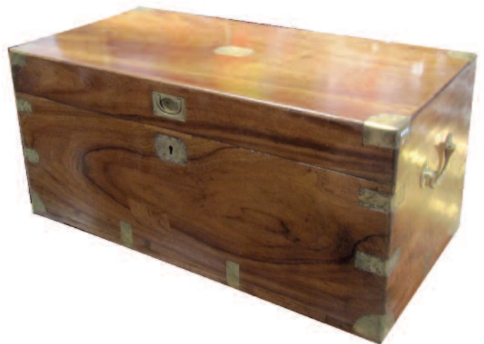
46 - Coffre de rangement en camphrier massif. Entrée de serrure, poignées et renforts de protection en laiton. Epoque fin XIXème. Hauteur : 40 cm. Longueur : 85,5cm. Profondeur : 43 cm. Bon état.