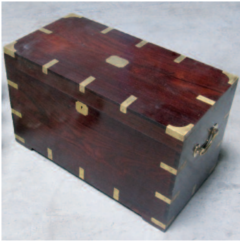
37 - Coffre de rangement en palissandre massif. Entrée de serrure, poignées et renforts de protection en laiton. Epoque fin XIXème. Longueur : 76 cm. Profondeur : 38,5 cm. Hauteur : 46 cm. Bon état.