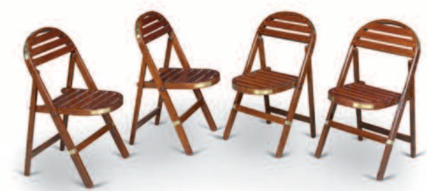
3 - Suite de huit chaises de pont pliantes, en acajou massif, à larges lattes et dossiers arrondis, renforts de protection et d'ornement en laiton. Circa 1930. Hauteur : 81 cm. Largeur : 46 cm. Profondeur : 40 cm. Bon état. 1600/1800