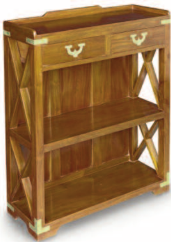
51 - Etagère basse en acajou avec un plateau central et deux tiroirs en partie supérieure. Barres anti-roulis sur le plateau, poignées de tiroirs et renforts de protection en laiton. Circa : 1960. Hauteur : 102 cm. Longueur : 88 cm. Profondeur : 30 cm. Bon état. 600/700