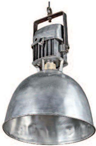
19 - Paire de lampes plafonnier de cargo en acier et aluminium alimentées en électricité avec réducteur et abat-jour en aluminium. Circa 1925. En état de fonctionnement.

Hauteur : 70 cm. Diamètre : 42 cm. Bon état.