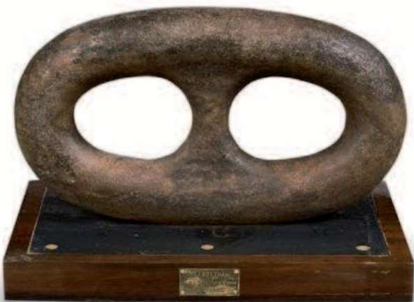
53 - Maillon de la chaîne d'ancre avant tribord du paquebot FRANCE. Cette chaîne en acier rond de 7 cm de diamètre, fut réalisée par la société VEILLE au HAVRE. Le poids de chaque maillon était à l'origine de 35 kilos, l'usure et la corrosion ont fait perdre à certains d'eux jusque 5% de leur poids initial. Chaque maillon a nécessité la découpe des deux maillons aux extrémités. Monté après démontage sur une base en teck pour la présentation. Longueur : 46 cm. Largeur : 26 cm. Bon état. 400/450