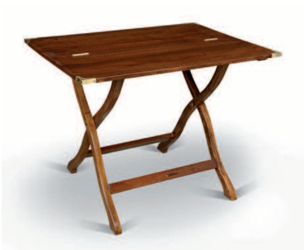
47 - Table rectangulaire en teck massif pliante en son centre reposant sur un double piètement en X relié par deux traverses. Hauteur : 72 cm. Longueur : 97 cm. Largeur : 69 cm. Bon état.