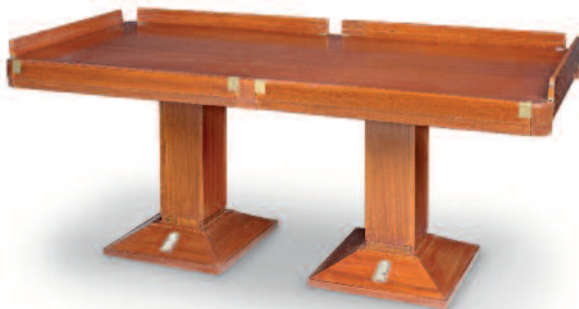
35 - Grande table de salle à manger de forme rectangulaire en acajou massif avec barres anti-roulis escamotables, reposant sur deux pieds parallélépipédiques avec trous de fixation au sol. En provenance du paquebot grec l'OLYMPIA. Hauteur : 76 cm. Longueur : 187 cm. Largeur : 79,5 cm. Très bon état.