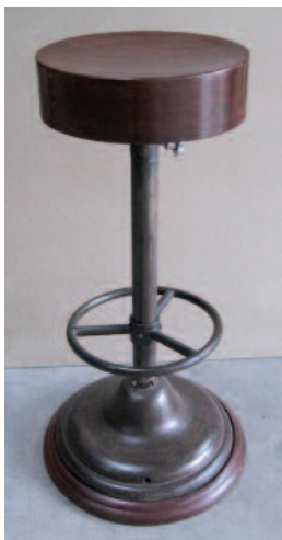
41 - Paire de tabourets de bar en fer et assise ronde en acajou. Circa : 1940. Hauteur : 86 cm. Diamètre de l'assise : 34,5 cm. Bon état.