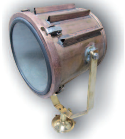
30 - Phare de recherche en laiton et à ailettes. Orientable par une manette sur l'arrière. Circa 1940. Hauteur : 90 cm - Diamètre : 41.5 cm. Bon état.