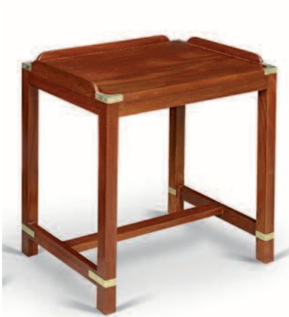
43 - Paire de petites tables d'appoint en acajou massif, barres anti-roulis sur le plateau, renforts de protection et d'ornement en laiton, entretoise en H. Hauteur : 61,5 cm, Largeur : 60,5 cm. Profondeur : 40 cm. Bon état.