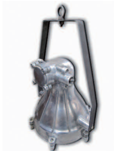
26 - Paire de phares de recherche en aluminium à ailettes et cache de protection pour la vitre. Harnais de fixation en fer. Alimentés en électricité et pouvant supporter jusqu'à 1000 watts. En provenance d'un cuirassé japonais. Circa 1940. Hauteur : 66 cm. Bon état.