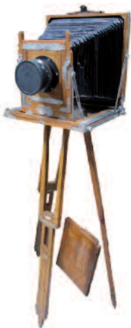
27 - Ancienne chambre de voyage en aluminium et laiton avec un trépied en bois. Epoque fin XIXème. Hauteur : 145 cm. Longueur : 38 cm. Profondeur : 35 cm. Bon état.