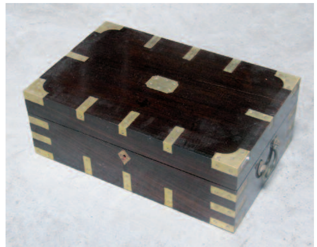
54 - Coffret de rangement en acajou massif. Poignées, entrée de serrure et renforts de protection en laiton. Epoque fin XIXème, début XXème. Longueur : 48 cm. Profondeur : 31 cm. Hauteur : 17 cm. Bon état. 350/400