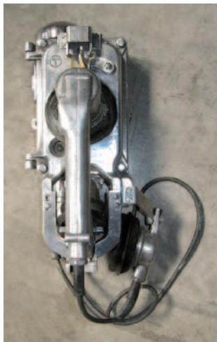
1 - Téléphone mural de forme rectangulaire en aluminium. Utilisé en interne par les membres de l'équipage. Circa 1950. Largeur : 11 cm. Hauteur : 38 cm. Profondeur : 12 cm. Bon état. 250/300