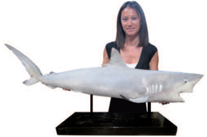
56 - Grand requin "citron" naturalisé présenté sur un socle en bois laqué noir. Il est appelé ainsi car il a une couleur plus jaune que les autres requins. On le trouve essentiellement dans la région subtropicale des côtes atlantiques et pacifiques du Nord et du Sud américain, mais aussi dans les îles du Pacifique et sur la côte ouest de l'Afrique. . Longueur : 136 cm. Bon état de conservation. 1100/1300