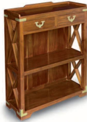
50 - Etagère basse en acajou avec un plateau central et deux tiroirs en partie supérieure. Barres anti-roulis sur le plateau, poignées de tiroirs et renforts de protection en laiton. Circa : 1960. Hauteur : 102 cm. Longueur : 88 cm. Profondeur : 30 cm. Bon état. 600/700