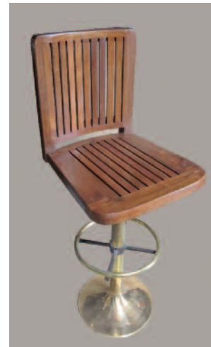
58 - Paire de tabourets de bar en laiton, fer et teck. Assise en teck massif, dossier à larges barreaux, piètement cylindrique en laiton avec son repose pieds circulaire. Circa 1925. Hauteur : 109 cm. Longueur : 37 cm. Profondeur : 46 cm. Bon état. 900/1000