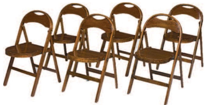
28 - Suite de six chaises de pont pliantes en teck massif à dossiers et assises arrondis. Circa 1920. Hauteur : 81 cm. Largeur : 45 cm. Profondeur : 40 cm. Bon état.