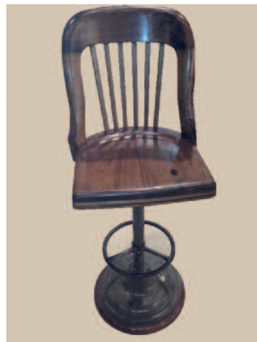
48 - Paire de tabourets de bar avec assise et dossier en teck sur un piètement et repose pieds circulaire en fer. Circa : 1940. Hauteur : 79 cm. Profondeur : 40 cm. Bon état.