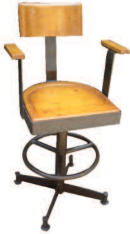
55 - Paire de chaises à bras en fer et bois teinté clair. Assise, dossier et accoudoirs en bois, le tout pivotant sur un piètement quadripode. Provenance : salle des Officiers d'un cuirassé japonais. Circa 1945. Très bon état. 950/1100