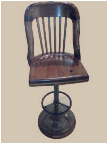
49 - Paire de tabourets de bar avec assise et dossier en teck sur un piétement et repose pieds circulaire en fer. Circa : 1940. Hauteur : 79 cm. Profondeur : 40 cm. Bon état. 900/1000