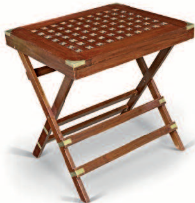
5 - Table pliante de paquebot en acajou massif, plateau de forme rectangulaire en caillebotis, renforts de protection et d'ornement en laiton. Largeur : 60 cm. Hauteur : 76 cm. Longueur : 80 cm. Bon état. 450/500