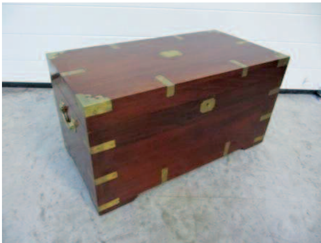
33 - Coffre de marine en teck massif. Poignées, entrée de serrure et renforts de protection en laiton. Epoque fin XIX e siècle. Longueur : 70 cm. Profondeur : 39 cm. Hauteur : 35 cm. Bon état.