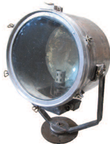
36 - Phare de recherche en aluminium et fer orientable par deux manettes reposant sur un petit pied circulaire. Provenance : cuirassé japonais. Circa 1940. Hauteur : 92 cm. Diamètre : 63 cm. Bon état.