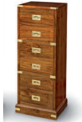
22 - Meuble de type "colonne" de compagnie maritime en teck massif sur plinthe. Six tiroirs en façade, poignées, renforts de protection et d'ornement en laiton. Hauteur : 112 cm. Largeur : 40,5 cm. Profondeur : 38,5 cm. Bon état.