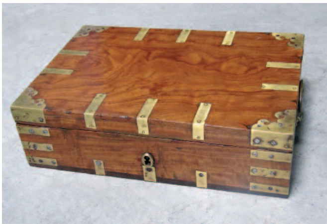
45 - Coffret d'officier de marine britannique en teck massif, intérieur compartimenté, entrée de serrure, poignées et renforts de protection en laiton. Circa 1910. Hauteur : 12 cm. Longueur : 42 cm. Profondeur : 29 cm. Bon état.