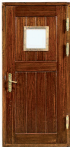
11 - Porte de bateau en acajou massif avec sabord, gonds et poignées en laiton, en provenance du paquebot Olympia. Circa 1950.

Hauteur : 189 cm. Largeur : 95 cm. Bon état.