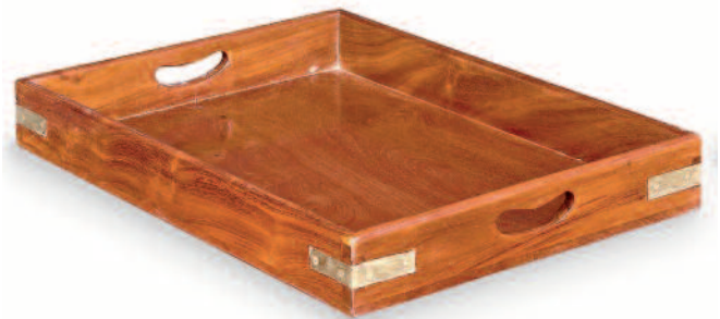
10 - Lot de deux plateaux de cabine en acajou massif avec renforts de protection et d'ornement en laiton. Provenance : P&O (Peninsular & Orient Company). Petit modèle - Hauteur : 7,5 cm. Longueur : 54,5 cm. Largeur : 36,5 cm. Grand modèle - Hauteur : 7,5 cm. Longueur : 63,5 cm. Largeur : 40,5 cm. Très bon état.