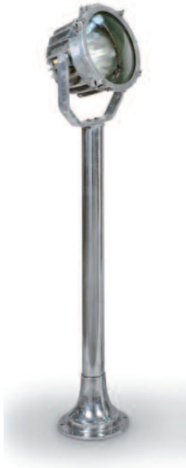
61 - Paire de phares de recherche en aluminium sur pied, montés sur un fût cylindrique en aluminium. Projecteurs orientables. Circa 1940. Hauteur : 145 cm. Diamètre : 32 cm. Bon état.