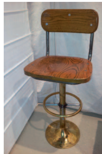
42 - Paire de tabourets de bar avec assise et dossier en teck, piètement en laiton avec repose pieds circulaire. Circa 1930. Hauteur : 106 cm. Longueur : 43 cm. Profondeur : 43 cm. Bon état.