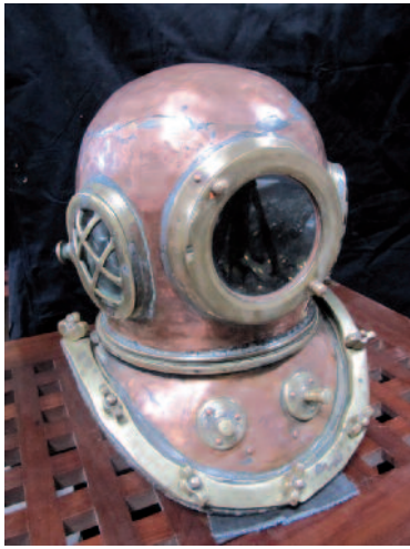
31 - Casque de scaphandrier japonais , en cuivre et laiton, modèle à douze boulons et trois hublots. Il possède une calotte renforcée particulièrement réservée pour les travaux de construction ou ramassage en mer de blocs de pierre. Circa 1940. Hauteur : 40 cm. Largeur : 35 cm. Profondeur : 40 cm. Bon état.