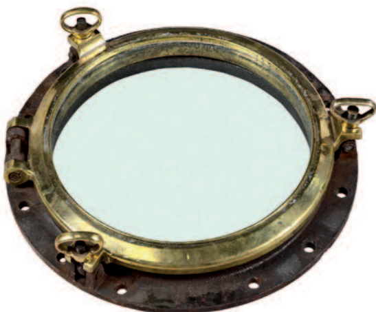
17 - Hublot ouvrant à trois clés , le tout en laiton et monté sur son châssis en acier. En provenance du paquebot MERMOZ et frappé sur le châssis de la Société SMF GSC. Douze trous d'ancrage sur la ceinture en acier. Ces hublots étaient à l'origine peints en blanc. Ils vous sont présentés ici décapés et polis. Diamètre total 53 cm. Diamètre vitre : 40 cm. Epaisseur : 7 cm. Bon état. 500/550