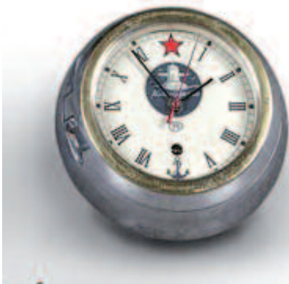
39 - Pendule de sous-marin russe dans son habitacle en aluminium avec cerclage en laiton, cadran émaillé blanc à chiffres romains, à décor d'un sous-marin et d'une étoile rouge. Livrée avec sa clé. En état de fonctionnement. Diamètre : 22 cm. Bon état.