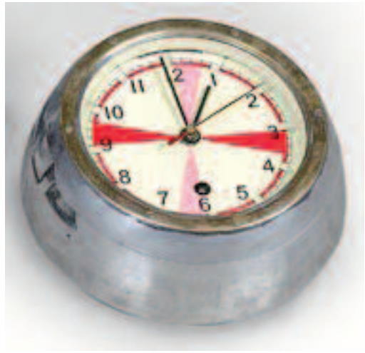
38 - Pendule de sous-marin russe dite "à temps de silence" pour la salle de transmission, habitacle en aluminium avec cerclage en laiton, cadran émaillé beige. Circa 1950. Livrée avec sa clé. En état de fonctionnement. Diamètre : 22 cm. Bon état.