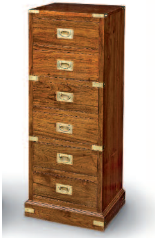
21 - Meuble de type "colonne" de compagnie maritime en teck massif sur plinthe. Six tiroirs en façade, poignées, renforts de protection et d'ornement en laiton. Hauteur : 112 cm. Largeur : 40,5 cm. Profondeur : 38,5 cm. Bon état.