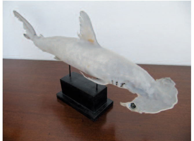
62 - Requin marteau naturalisé (Sphyrna mokarran).

Caractérisé par ses deux larges extensions latérales aplaties au niveau du crâne. Celles-ci leur permettant une large portance et la pratique de virages plus serrés que les autres requins. Leurs yeux et leurs narines sont situés aux extrémités de chaque extension, leur apportant un champ de vision supérieur qui leur permet de pourchasser plus facilement leur proies. Longueur : 79 cm. Etat de conservation : très bon.