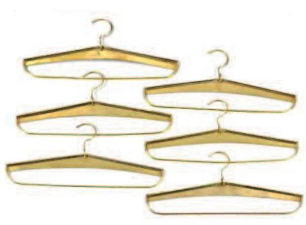
44 - Lot de douze cintres en laiton en provenance d'un paquebot norvégien. Longueur : 39 cm. Bon état.