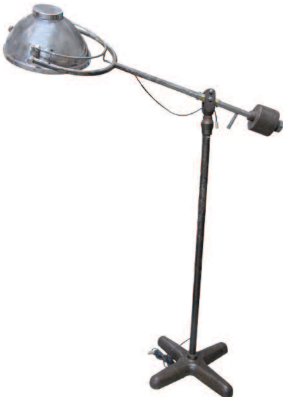
63 - Importante lampe de bloc opératoire de paquebot, appelée scialytique, en aluminium, fer et laiton. Piètement cruciforme, large réflecteur orientable et abaissable, important contre-poids en plomb. Alimentée en électricité. Circa 1930. Hauteur du pied : 177 cm. Très bon état.