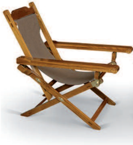
57 - Paire de transats de pont pliant en érable massif, système d'inclinaison en laiton et bras coulissants. Tissu marron postérieur. Hauteur : 97 cm. Largeur : 65 cm. Profondeur : 86 cm. Très bon état. 1100/1200