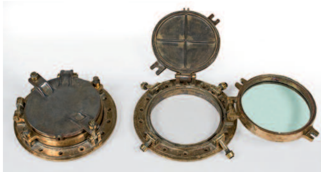
6 - Hublot du paquebot FRANCE , en laiton ouvrant à deux vis et occultant par tôle en alliage d'aluminium et deux vis d'ouverture supplémentaires. Fabriqué par la SOCIETE NANTAISE DE FONDRIES REUNIES ET DE CONSTRUCTIONS MECANIKES, 7 Boulevard des Martyrs nantais de la Résistance. Treize trous d'ancrage en ceinture. Ces hublots étaient à l'origine peints en blanc ou bleu. Ils vous sont présentés ici décapés et polis. Diamètre total : 45cm. Diamètre vitre : 33 cm. Bon état. 780/820