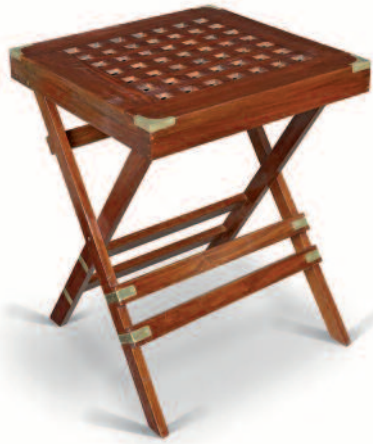
13 - Table pliante de paquebot en acajou massif avec plateau de forme carrée en caillebotis. Largeur : 60 cm. Hauteur : 76 cm. Longueur : 60 cm. Bon état. 420/470