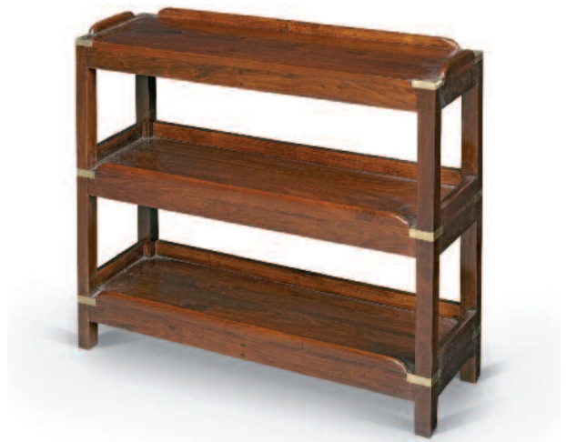
24 - Petite étagère en palissandre massif à trois niveaux, barres anti-roulis en pourtour du niveau supérieur, renforts de protection et d'ornement en laiton.

Hauteur : 72 cm. Largeur : 86 cm. Profondeur : 29 cm. Très bon état.