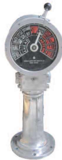
16 - Indicateur d'ordre japonais sur pied double face en aluminium. Cadran en tôle émaillée à fond noir et sélecteur en aluminium et bakélite. Circa 1940. Hauteur : 112 cm. Profondeur : 33 cm. Diamètre : 37 cm. Très bon état. 1000/1200