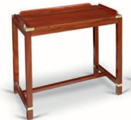
59 - Table d'appoint en acajou massif, barres antirouils en pourtour du plateau, renforts de protection et d'ornement en laiton, entretoise en H. Hauteur : 71 cm. Longueur : 76 cm. Profondeur : 46 cm. Bon état. 320/360