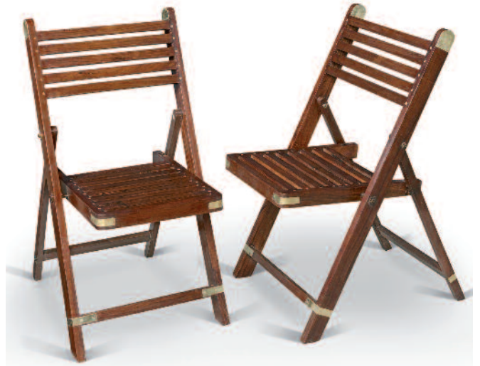
8 - Suite de six chaises pliantes de pont en palissandre massif à larges lattes sur le dossier et l'assise. Renforts de protection et d'ornement en laiton. Circa 1935.

Hauteur : 84 cm. Largeur : 44 cm. Profondeur : 46 cm. Très bon état.