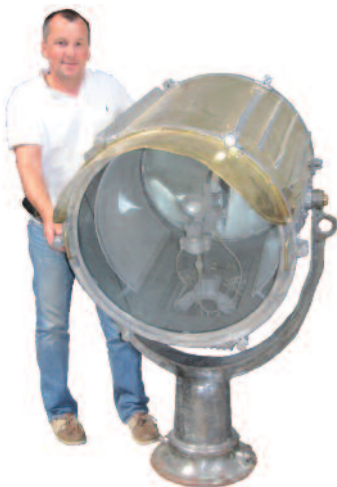
23 - Important phare de recherche en laiton et ailettes en aluminium. Piètement circulaire en fonte de fer permettant la rotation. Casquette frontale en laiton pour la réverbération et nombreuses manettes directionnelles. Alimenté en électricité et pouvant supporter une puissance de 5000 watts. Provenance : cuirassé japonais. Circa 1940. Hauteur : 140 cm. Diamètre : 90 cm. Bon état.