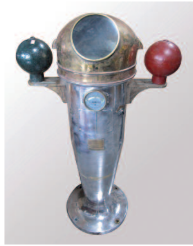
32 - Compas de route japonais en aluminium sur pied de forme conique et trous de fixation. Capot en laiton avec système de compensation magnétique assuré par deux boules latérales de compensation par THOMSON, en fer doux et un tube vertical en laiton à l'arrière appelé tube de FLINDERS ainsi qu'un niveau avec cadran en laiton. De marque TOKYO KEIKI SEIZOSHO CO.LTD. Circa 1940. Largeur : 82 cm. Hauteur : 132 cm. Bon état.