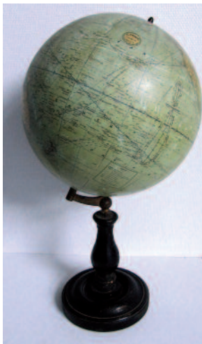
15 - Globe terrestre incliné sur un axe et monté sur un pied en bois tourné noirci. Par G. THOMAS à Paris, 44 rue Notre Dame des Champs. Fin du XIX ème siècle. Hauteur : 57 cm. Bon état. 600/800