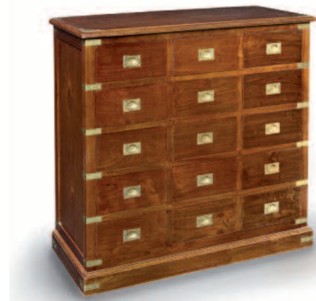
60 - Grand meuble de rangement en teck massif monté sur plinthe. Quinze tiroirs en façade, poignées, renforts de protection et d'ornement en laiton. Circa 1930. Hauteur : 100 cm. Largeur : 93 cm. Profondeur : 37 cm. Bon état. 1200/1500