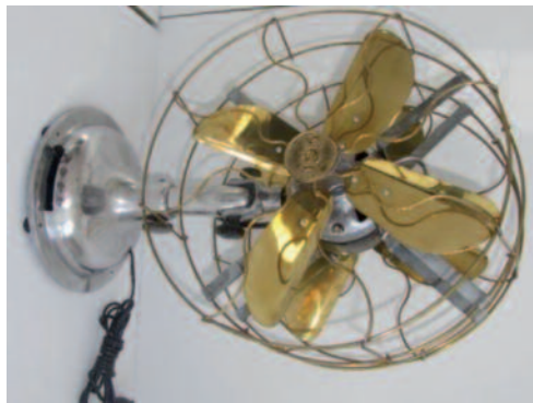
2 - Ventilateur à double hélices de quatre pales en laiton montées sur un piètement circulaire en aluminium, cache de protection pour les pales en laiton. Circa 1940. Hauteur : 49 cm. Restauré aujourd'hui pour fonctionner sur le 220 volts. 250/300