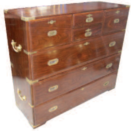
14 - Commode de marine en palissandre massif à deux corps et sept tiroirs en façade. Entrées de serrures, poignées de tiroirs, renforts de protection et d'ornement en laiton. Epoque fin XIX ème . Hauteur : 107 cm. Longueur : 92 cm. Profondeur : 39 cm. Bon état. 1900/2100