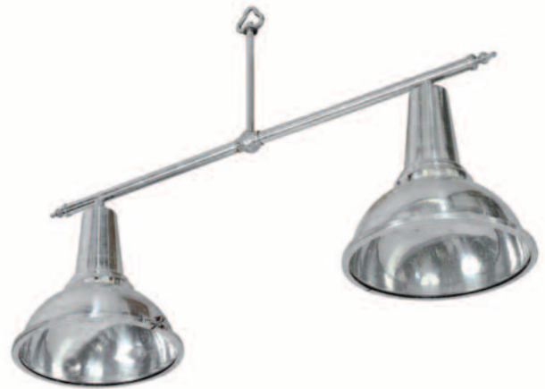
52 - Lustre de cargo en aluminium composé de deux phares réunis par une barre de maintien. Alimenté en électricité. Circa 1950. Hauteur : 76 cm. Longueur : 118 cm. Diamètre : 37 cm. Bon état. 320/400