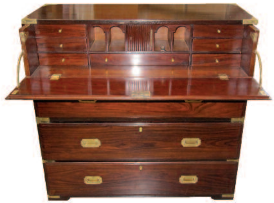
20 - Commode secrétaire de marine en palissandre massif à deux corps et quatre rangées de tiroirs en façade, le tiroir supérieur découvrant un abattant et formant écritoire, agrémenté de petits casiers et tiroirs. Entrées de serrures, poignées de tiroirs, renforts de protection et d'ornement en laiton. Epoque : fin XIX e siècle.

Longueur : 101 cm. Profondeur : 41 cm. Hauteur : 98 cm. Bon état.