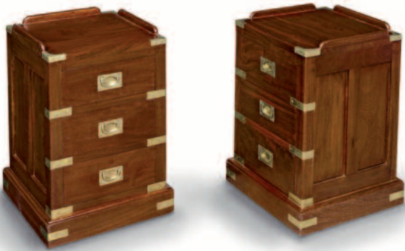
9 - Paire de chevets en acajou massif à trois tiroirs, barres anti-roulis sur la plateau, renforts de protection et poignées en laiton.

Hauteur : 53,5 cm. Largeur : 35,5 cm. Profondeur : 36 cm. Bon état.