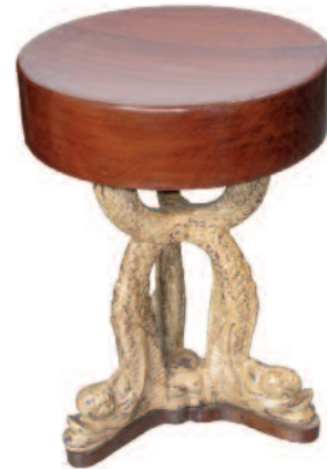
34 - Suite de quatre tabourets à piètement tripode en fonte à décor de dauphins stylisés. Epaisse assise pivotante en acajou massif. Hauteur : 52 cm. Diamètre : 37 cm. Circa 1920. Bon état. (Pourront être divisés en paire).