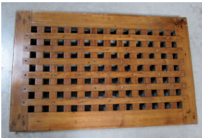
29 - Caillebotis de bateau en bois clair. Circa 1930. Longueur : 110 cm. Largeur : 70cm. Bon état.