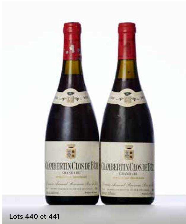
Lots 440 et 441