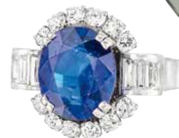
IMPORTANT SAPHIR BIRMAN 6,50 CARATS ENV.