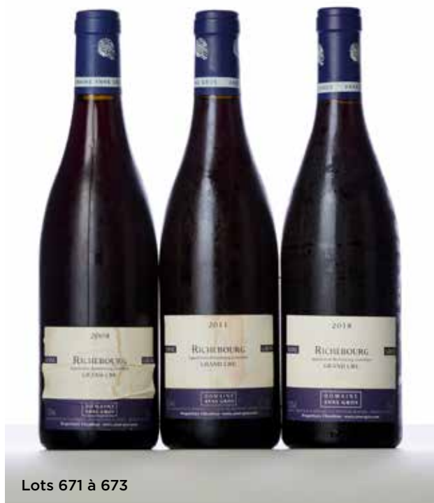
Lots 671 à 673

CHABLIS MONTEE DE TONNERRE (1° Cru) - 2018 1 Bouteille Domaine François Raveneau