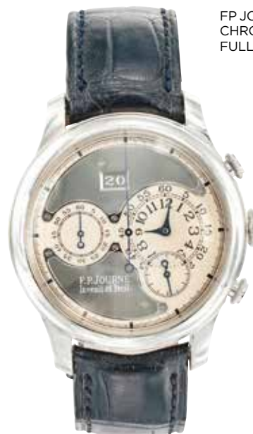
FP JOURNE «OCTA CHRONOGRAPHE» FULL SET