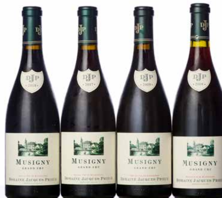
Lot 375 à 378