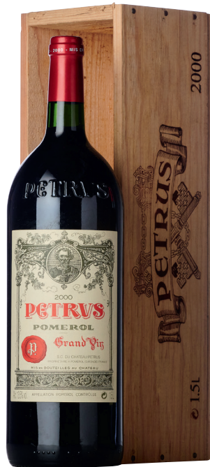
PETRUS 2000 POMEROL