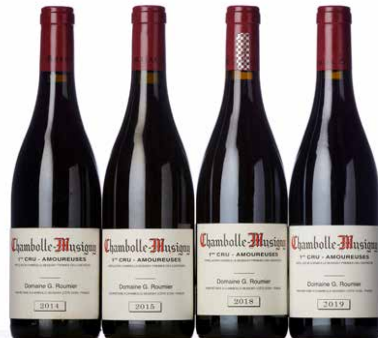
Lot 1511 à 1514