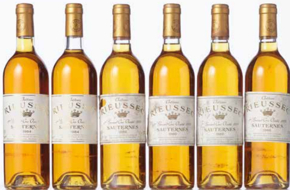
Lot 1969 Lot Panaché (Mixed Lot)