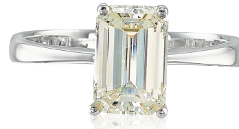
DIAMANT TAILLE ÉMERAUDE 3,03 CTS