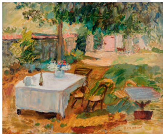
PIERRE BONNARD, HUILE, 1908