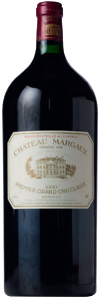
IMPÉRIALE CHÂTEAU MARGAUX 1990