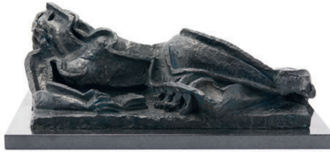
OSSIP ZADKINE BRONZE, 1947