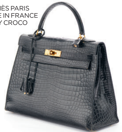
HERMÈS PARIS MADE IN FRANCE KELLY CROCO

DIMANCHE 27 DÉCEMBRE À 14H 100 % CHAMPAGNES, CHARTREUSES & ALCOOLS / LUNDI 28 & MARDI 29 DÉCEMBRE À 14H VINS RARES & PRESTIGIEUX / MERCREDI 30 DÉCEMBRE À 14H30 TABLEAUX & SCULPTURES, MODERNES & CONTEMPORAINS - ASIE-CHINE / MERCREDI 30 DÉCEMBRE À 17 H 30 MONTRES MODERNES & DE COLLECTION / JEUDI 31 DÉCEMBRE À 13 H 30 MODE, BAGAGES & MAROQUINERIE / JEUDI 31 DÉCEMBRE À 14H IMPORTANTS DIAMANTS - HAUTE JOAILLERIE & BIJOUX SIGNÉS, PIERRES DE COULEUR