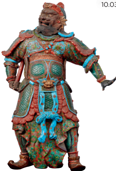
CHINE, PÉRIODE MING