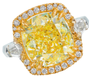
DIAMANT FANCY YELLOW / VS2 10.03 CTS