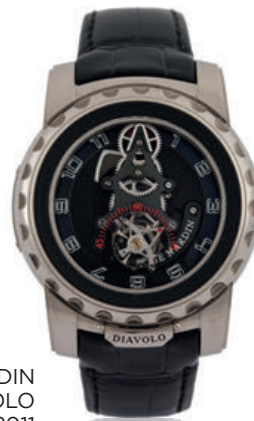
ULYSSE NARDIN FREAK DIAVOLO VERS 2011