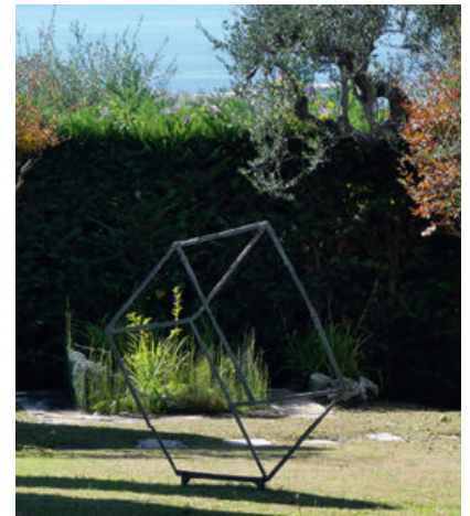
BRUNO ROMEDA PERSPECTIVE CUBIQUE, 1972