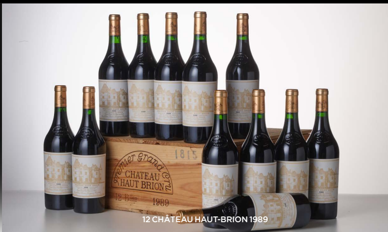
12 CHATEAU HAUT-BRION 1989