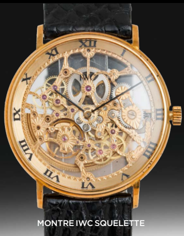
MONTRE IWC SQUELETTE

VENTES AUX ENCHÈRES CANNES HÔTEL MARTINEZ