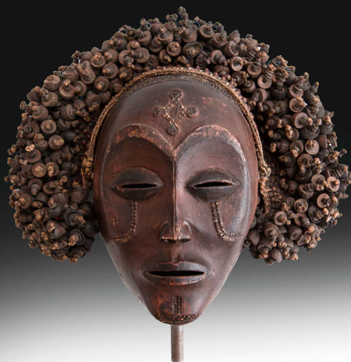
MASQUE DE DANSE « MWANA PO »

VENDREDI 19 AVRIL À 13H30 Vins prestigieux & Alcools rares SAMEDI 20 AVRIL À 10H30 PUIS 13H30 Vins prestigieux & Alcools rares DIMANCHE 21 AVRIL À 14H30 Art Tribal d'Afrique noire Tableaux modernes & Art Contemporain LUNDI 22 AVRIL À 13H30 Importants diamants Bijoux signés et d'artistes Pièces d'or Montres modernes & de collection