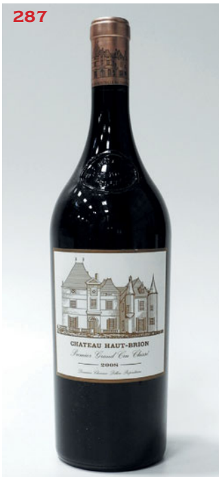
285 CHÂTEAU LATOUR 1995 GCC1 Pauillac

(légère marque capsule sinon état parfait) 1 Magnum • 700 / 750 €