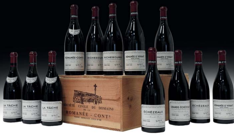
Assortiment 12 b du Domaine de la Romanée-Conti 1996 Pascal KUZNIEWSKI - Expert