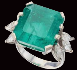
Émeraude 14,20 carats

SAMEDI 15 JUILLET 11H/14H VINS PRESTIGIEUX & ALCOOLS RARES DIMANCHE 16 JUILLET 14H BIJOUX, MONNAIES ET MÉDAILLES D'IRAN, BIJOUX DE CHARME DIMANCHE 16 JUILLET 16H CHANEL VINTAGE