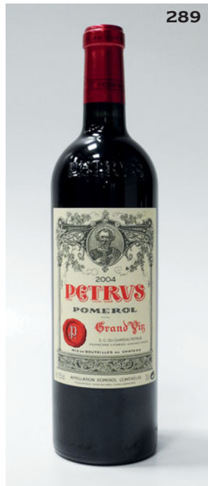
289 PETRUS 2004 Pomerol