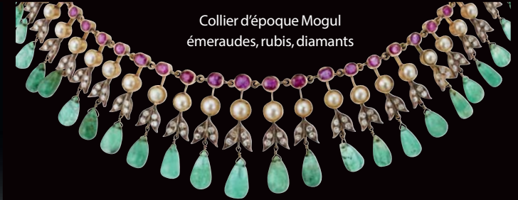
Collier d'époque Mogul émeraudes, rubis, diamants