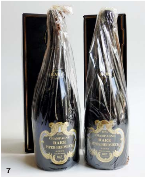
4 CHAMPAGNE DOM PERIGNON 1985 Moët et Chandon (Coffret légèrement marqué) (quelques marques étiquette et coiffe) 1 Bouteille • 180 / 200 €