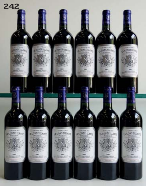
242 CHÂTEAU LA CONSEILLANTE 2001 Pomerol (flamme de caisse incluse) (minuscule accroc sur 1 étiquette) 12 Bouteilles • 1020 / 1140 €

243 Lot Panaché (mixed lot) CHÂTEAU LA LAGUNE 1995 1 Bouteille GCC3 Haut-Médoc CHÂTEAU VIEUX FERRAND 1988 3 Bouteilles Pomerol VIEUX CHÂTEAU CERTAN 1994 1 Bouteille Pomerol 5 Bouteilles • 130 / 140 €