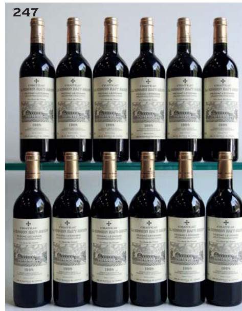
247 CHÂTEAU LA MISSION HAUT-BRION 1998 CC Graves (flamme de caisse incluse) (quelques très légères marques sur quelques étiquettes sinon parfaites) 12 Bouteilles • 2400 / 2640 €

246 CHÂTEAU LA MISSION HAUT-BRION 1997 CC Graves (flamme de caisse incluse) 12 Bouteilles • 1080 / 1200 €