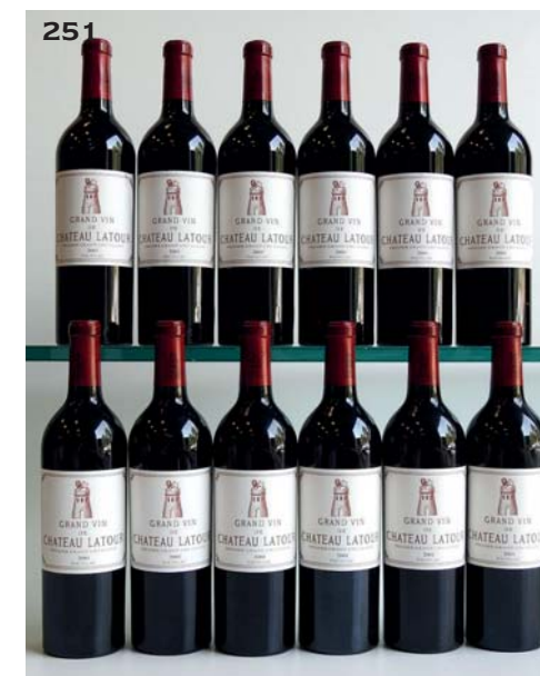
251 CHÂTEAU LATOUR 2001 GCC1 Pauillac (flamme de caisse incluse) (1 pli d'origine sur 1 étiquette) 12 Bouteilles • 3840 / 4080 €

252 CHÂTEAU LATOUR MARTILLAC Blanc 1995 CC Graves (7 T.L.B+ ou mieux et 1 T.L.B) 8 Bouteilles • 120 / 140 €