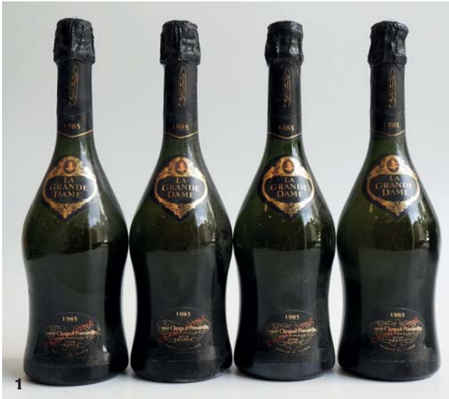
1 CHAMPAGNE LA GRANDE DAME 1985 Veuve Clicquot Ponsardin (quelques marques coiffes sinon belles) 4 Bouteilles • 500 / 600 €