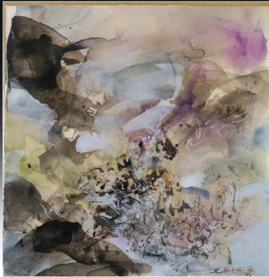
ZAO WOU KI